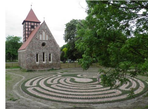
Station 6: Der Zauber von Chartres