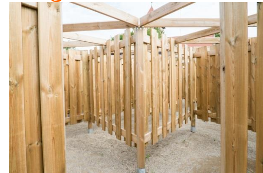
Station 7: Großer Irrgarten - verlauf dich nicht!