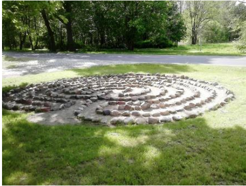
Station 3: Das Ur-Labyrinth entdecken