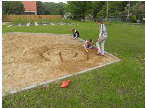
Station 4: Labyrinth zeichnen - klein und groß