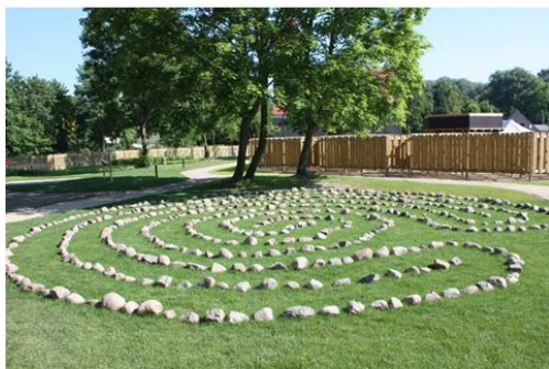
Station 5: Sport und Spiel im Eberswalder Wunderkreis